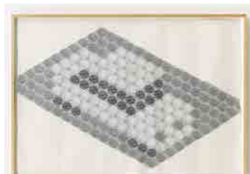
'Entwurf für U-Bahn (Auto) Design for Subway (Car)', 1990, photocopy collage on paper, 169 x 296 cm, unique.

In lijn met recente tentoonstellingen over niet gerealiseerde of als mislukt beschouwde kunstwerken, stelt dépendance in Brussel momenteel zeven werken voor van de Duitse kunstenaar Thomas Bayrle, die in 2014 nog een gesmaakte overzichtstentoonstelling had in Wiels. Het gaat om een reeks werken die de kunstenaar in 1990 maakte als ontwerp voor een metrostation in Offenbach, dichtbij Frankfurt am Main. De door hem gekozen motieven – een auto, vliegtuig, trein en voetganger – passen dan wel mooi binnen de context van de openbare opdracht, maar ze werden niet weerhouden.