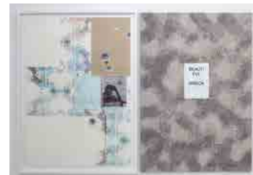
Links: Dirk Stewen, 'Untitled', 2012, framed, laser prints, gouache, confetti, thread and tape on paper and inked paper, 138 x 100 cm, 126 x 89 x 3 cm. Rechts: Are Blytt, 'Beautiful Wreck', 2019, acrylic paint on Belgian linen canvas, 135.5 x 95.5 cm

Nieuw talent ontdekken, we love it! Sinds ons bezoek aan Marie-Laure Fleisch (MLF) staan Are Blytt (°1981) en Dirk Stewen (°1972) op onze radar. Respectievelijk afkomstig van Noorwegen en Duitsland, delen beide kunstenaars een interesse voor fotografie, tekst en abstractie. Bij MLF tonen ze hun kunst voor het eerst naast elkaar, als autonome werken, en – op de benedenverdieping – ook samen als één kunstwerk.