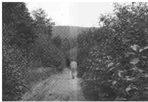
Yuki Okumura, '29,771 days – 2,094,943 steps', 2019. Scanned and partly overlaid published photographic image; archival pigment print on paper, image: 38 x 56 cm

Sinds januari is Brussel nog maar eens een galerie rijker. Meer zelfs: eigenlijk vier voor de prijs van één. Zo delen Lambdalambdalambda (Pristina), Lulu (Mexico City), Park View / Paul Soto (Los Angeles) en MISAKO & ROSEN (Tokyo) afwisselend een (vrij beperkte) ruimte op het gelijkvloers van een historisch gebouw in Sint-Gillis met als overkoepelende naam LA MAISON DE RENDEZ-VOUS. Na de openings-tentoonstelling 'La peinture abstraite' waar vier schilderijen te zien waren – één per galerie – mag MISAKO & ROSEN nu de spits afbijten. Ex-Wielsresident Yuki Okumura toont er een reeks werken waarin zijn fascinatie voor twee ongreepbare figuren uit de recente kunstgeschiedenis samenkomen: On Kawara en Stanley brouwn. Beiden deelden niet alleen een manier om respectievelijk tijd en ruimte op eigen wijze te meten, maar ook een vorm van discretie – wat in deze tijden van Instagram en andere tools voor schaamteloze zelfpromotie een steeds grotere deugd is. Zo zijn van beiden nauwelijks (portret)foto's bekend.